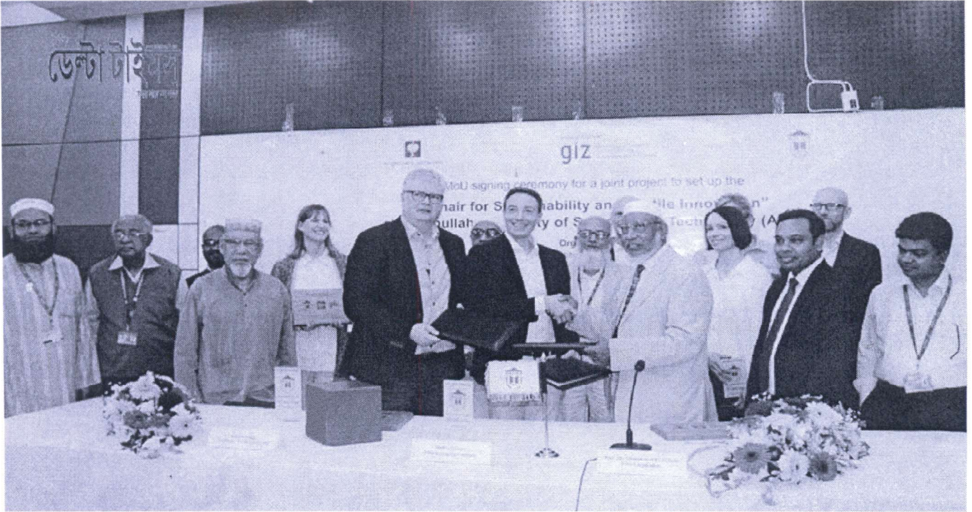
আহছানউল্লা বিশ্ববিদ্যালয়ের সাথে জার্মানীর এনজেলবাট ও জিআইজেড এর সমঝোতা চুক্তি

আহছানউল্লা বিজ্ঞান ও প্রযুক্তি বিশ্ববিদ্যালয়ের সাথে জার্মানির প্রতিষ্ঠান এনজেলবাট স্ট্রাউস ও জিআইজেড-এর মধ্যে সমঝোতা চুক্তি সই হয়েছে সোমবার (২৪ ফেব্রুয়ারি)